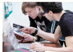
Salle de cours