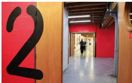
Accès à la bibliothèque