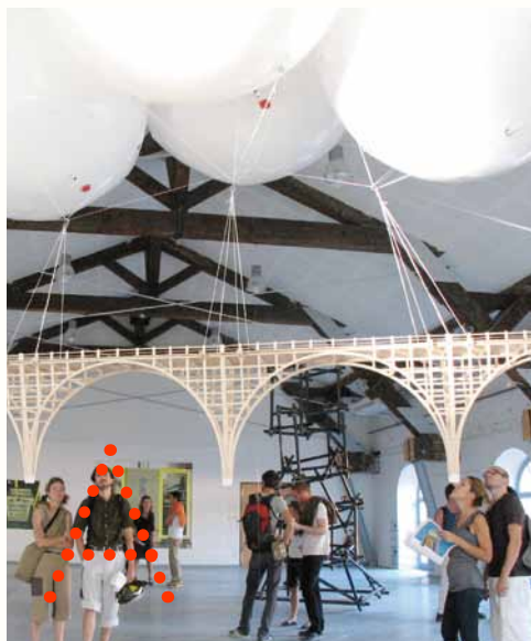
Atelier 4 ème et 5 ème année

Suite à sa transformation, en 2011, en Établissement Public de coopération culturelle (EPCC), l'École nationale supérieure des beaux-arts de Lyon s'ouvre aux partenariats d'entreprises.