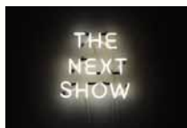
Hors les murs, Rendez-vous 2008