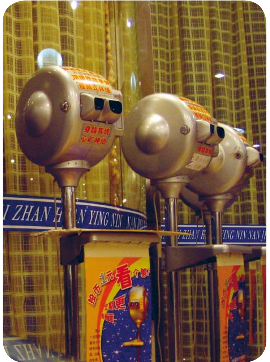
Nanjing Stereoviewer (Lunettes stéréoscopiques à Nanjing, Chine) (détail), 2005 © Laurent Mulot