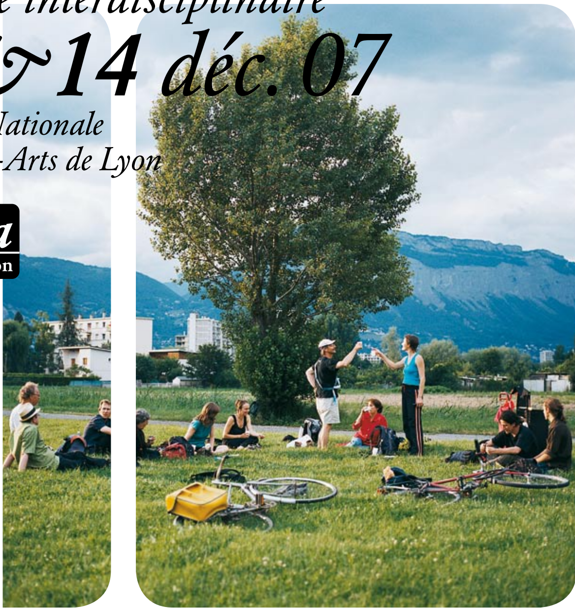
Collectif Ici-Même [Grenoble], «Promenade réaliste», 22 juin 2007