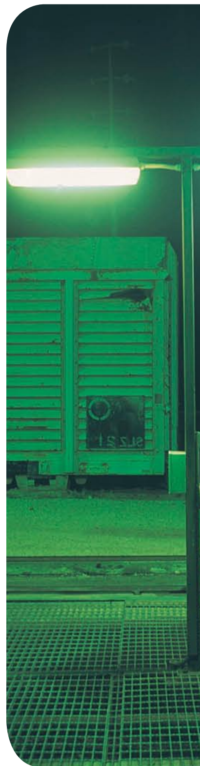
Middle of Nowhere, «Cook palindrome» (détail), 2003, Laurent Mulot

C'est de ce milieu que le travail continue sur le globe à tisser sa toile, en Australie, en Chine, en France, au Brésil, bientôt au Maroc et sur le web : www.mofn.org